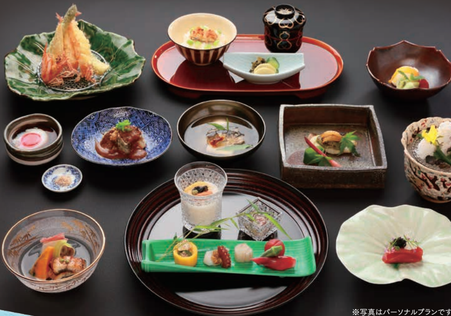
※写真はパーソナルプランです。

2024年7月1日(月)～8月31日(土) 17時～21時(最終19時スタート) 要予約 ※8月15日(木)・8月16日(金)を除く。